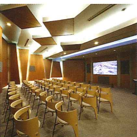
5階 ハイビジョンギャラリー