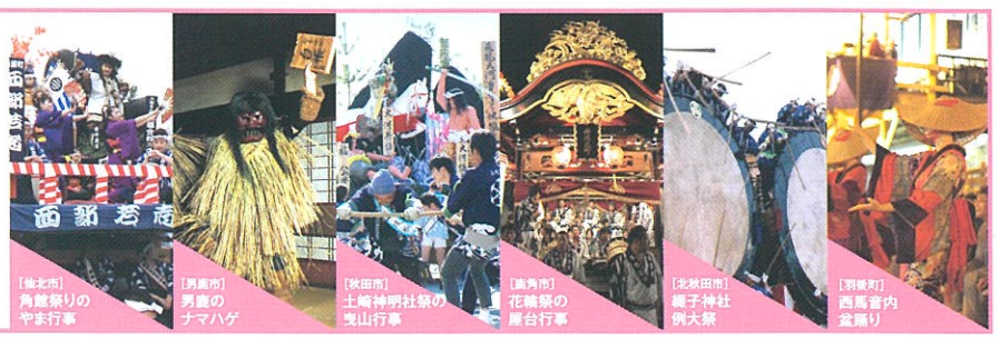
[雄物山] 角籠祭りのやま行事 [男鹿市] 男鹿のチマハゲ [秋田市] 土崎神明社祭の夜山行事 [鹿角市] 花輪祭の屋台行事 [北秋田市] 糠子神社例大祭 [羽後町] 西馬音内盆踊り