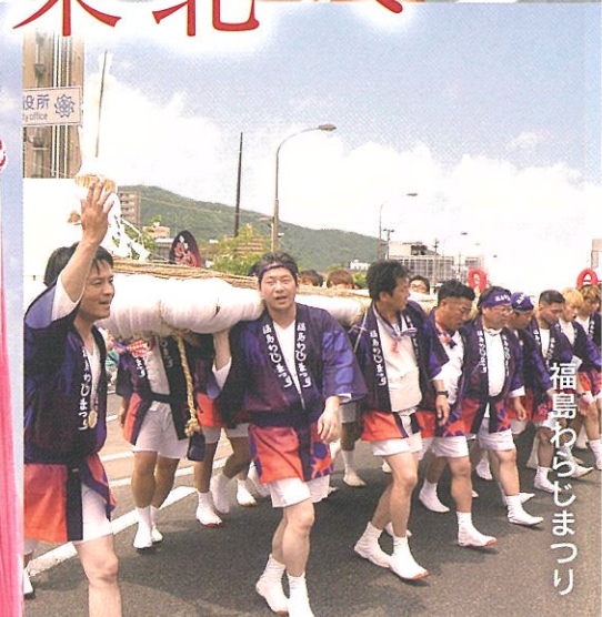
福島わらじまつり