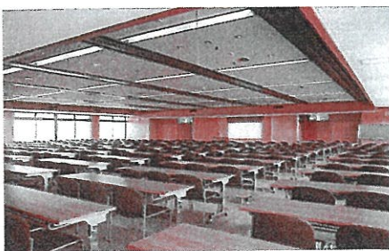
10F 大会議室…会議、研修会・講習会のほか、企業PR・商品発表会などの販売促進活動の会場としても御利用いただけます。