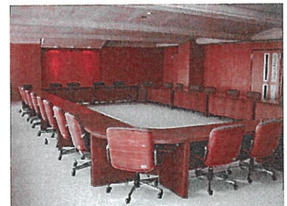
特別会議室…会議、研修会・講習会などに御利用いただけます。