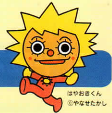
はやねくん ©やなせたかし