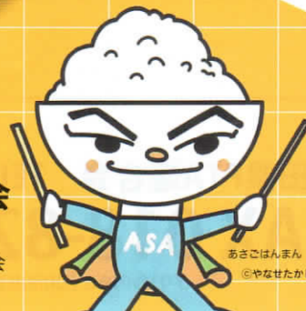
あさごはんまん ©やなせたかし