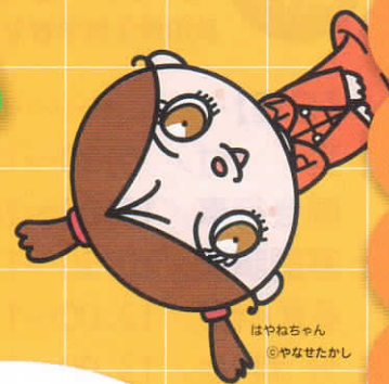
はやねちゃん ©やなせたかし