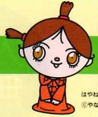
はやねちゃん ©やなせたかし