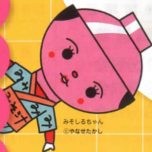
みそしるちゃん ©やなせたかし

このフォーラムはその対策の一つとして、園児から高校生までの子どもを持つ保護者や県民のみなさんが、意見や悩みを共有しながら、子育てについて理解を深めることを目的としています。