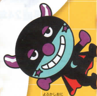
よるかしおに ©やなせたかし

土井善晴（どいよしはる） 料理研究家。1957年大阪に生まれる。スイス、フランスでフランス料理を、大阪の「味吉兆」で日本料理を修業。土井勝料理学校講師を経て、92年「おいしいもの研究所」を設立。テレビや雑誌で料理を指導する他、レストラン等のプロデュース、早稲田大学文化構想学部非常勤講師など、活動は多数。