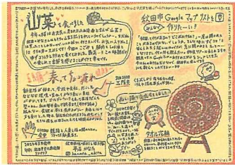
リングラフで制作するZINEの一例