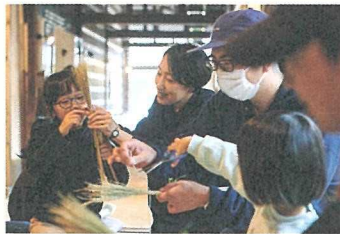
さまざまな年代が楽しめるワークショップ