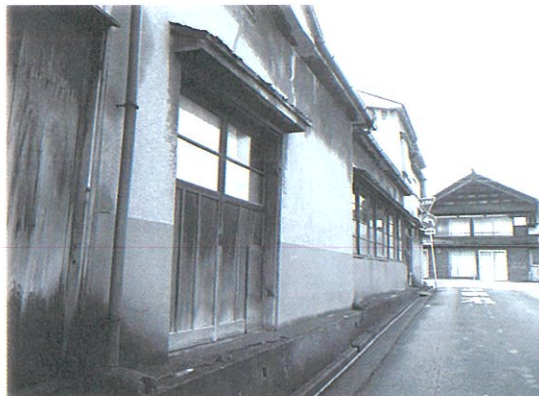
KAZUさんが撮影した、ある日の馬口労町周辺