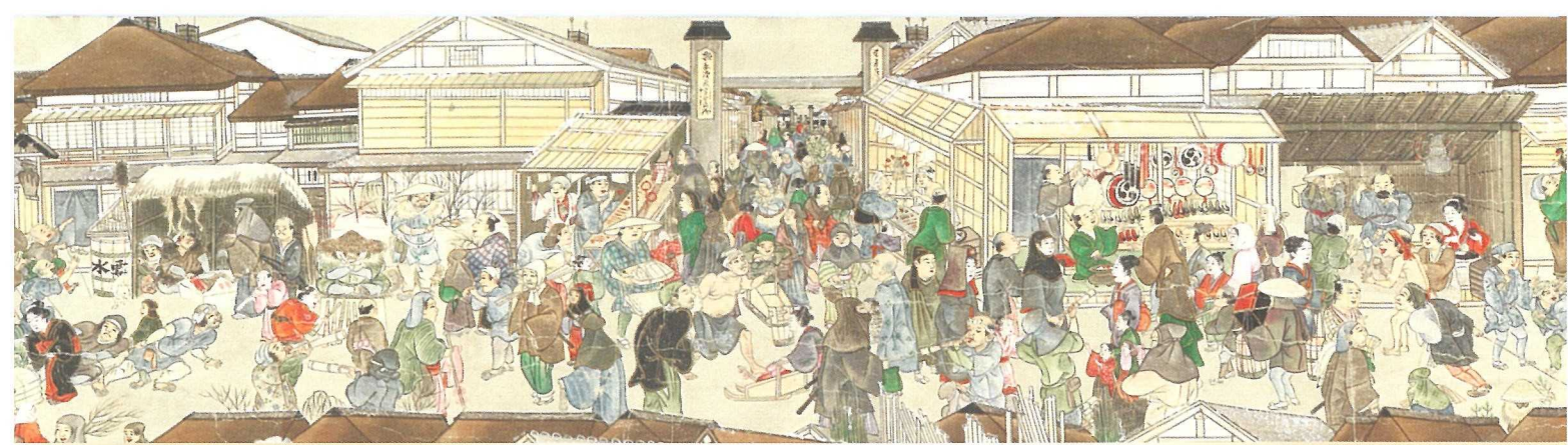
秋田風俗絵巻（当館蔵）

秋田の人々が守り伝えてきた絵画、工芸品、考古・歴史資料。秋田には地域の記憶をものがたる宝物がたくさんあります。地元の宝を知れば、地元で暮らす楽しみも増えます。展示室でゆっくり文化財を眺めて、地域の価値を見直してみませんか。