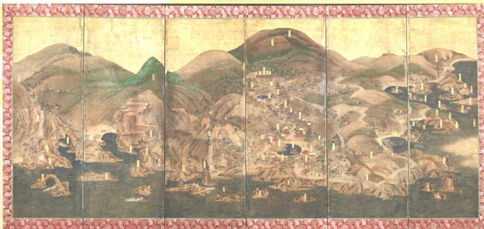
男鹿図屏風右隻（当館蔵）