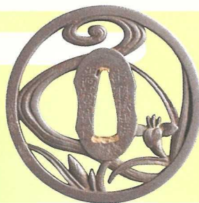
鐺 あやめ図透彫 （正阿弥二代作）（当館蔵）