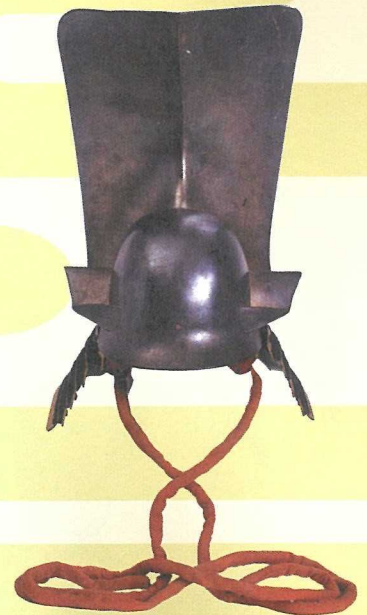
秋田家資料一ノ谷兜 （当館蔵）