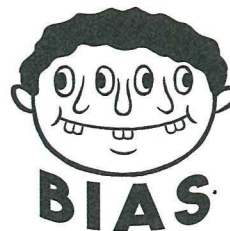
ばいあす bias イラストレーター