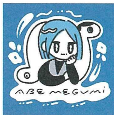
あべめぐみ 阿部希未 イラストレーター