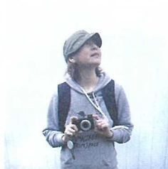
おみお omio コピーライター