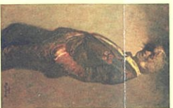
鶴屋純(幼名) 1985年 油彩・カンヴァス 空間自動車美術館蔵

〈特別展〉 日本の洋画130年 珠玉の名品たち —般/1,000円 学生/800円 中学生以下無料