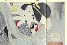
月岡芳年 「風俗三十二相 けむさう」 享和年間内室之風俗