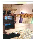
関谷四郎記念館 人間国宝の辰と美 後期 5/12日

〈常設展示〉 年鑑をはじめとする秋田市の民俗行事や芸能を紹介。年鑑や本誌の体験もできる。