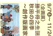
勝平得之「生誕120年記念 秋田の四季 ～創作版画家・勝平得之展」 1979年