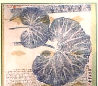
安達多病堂印葉図 (名古屋市東山植物園蔵)