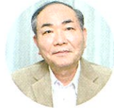
特別審査委員長 出久根 達郎氏

1928年、福井市生まれ。 1965年「玩具」で芥川賞を受賞。 『流星雨』で女流文学賞、『智恵子飛ぶ』で芸術選奨 文部大臣賞、『紅梅』で菊池寛賞など受賞作多数。 日本芸術院会員。