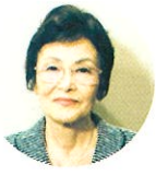
顧問 津村 節子氏

1928年、福井市生まれ。 1965年「玩具」で芥川賞を受賞。 『流星雨』で女流文学賞、『智恵子飛ぶ』で芸術選奨 文部大臣賞、『紅梅』で菊池寛賞など受賞作多数。 日本芸術院会員。