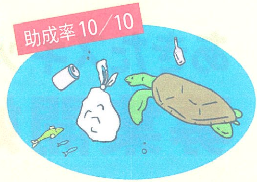
秋田県との包括連携協定締結企業による冠ファンド一覧表

秋田県と包括連携協定を結んだ企業が、県内の様々な地域課題解決に取り組むNPO等の活動を支援する冠ファンドです。