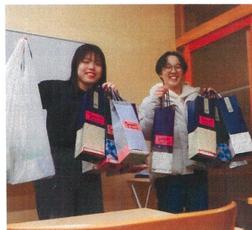
生理用品配布の準備の様子