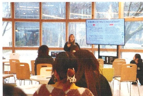
「生理のあいう」というイベントの様子