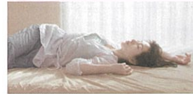
島村信之《日差し》 2009年 ホキ美術館蔵

8/4㊦～9/27㊦ 〈特別展〉 超写実 ホキ美術館名品展 一般/1,300円 60歳以上/1,000円 大学生/1,000円 高校生以下無料