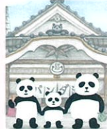
『パンダ饅頭』 (2013年、絵本館) ©tupera tupera

4/25㊦～7/5㊦ tupera tuperaの キナナル アニマル 絵本原画展 一般/1,300円 大学生/800円 高校生以下無料