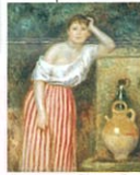
オーギュスト・ロダン 《泉のそばの少女》 1887年 空間日動美術館蔵

1/24㊦～4/5㊦ 〈企画展〉 平野政吉の あつめた西洋絵画 一般/310円 シニア/280円 学生/210円 高校生以下無料