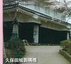
秋田城跡歴史資料館