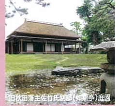
旧秋田藩主佐竹氏別邸(如斯亭)庭園