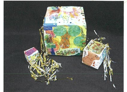
R 7年度受賞作品【自由作品】