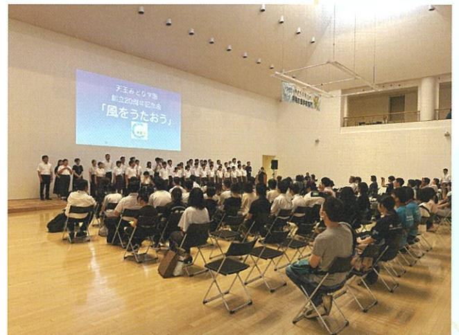
写真は昨年度の様子