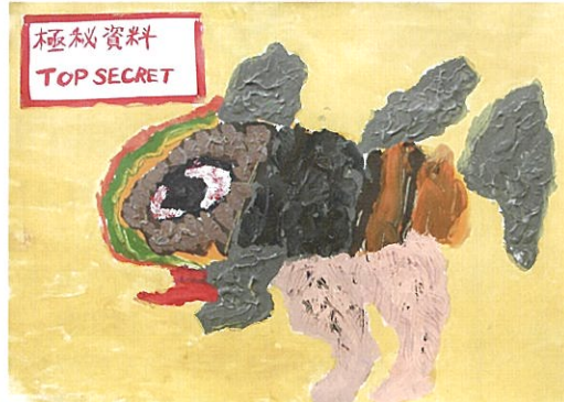
R 7年度受賞作品【絵画】

今年度は秋田市文化創造館 1Fコミュニティスペース、2FスタジオBで開催します。 想いやエネルギーがギュッとつまった絵画作品が会場いっぱい並びます。 一人一人の自由な発想と伸びやかで豊かな表現をお楽しみください。