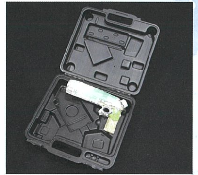
R 7年度受賞作品【自由作品】