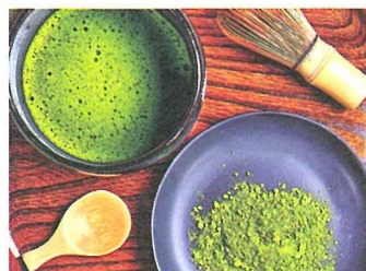
茶道部 (高校)・日本文化部 (中等部)