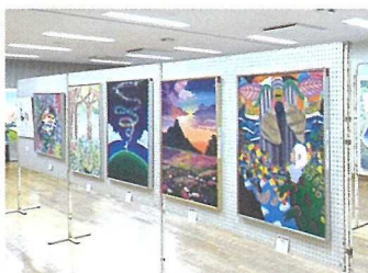
美術部 (高校・中等部)